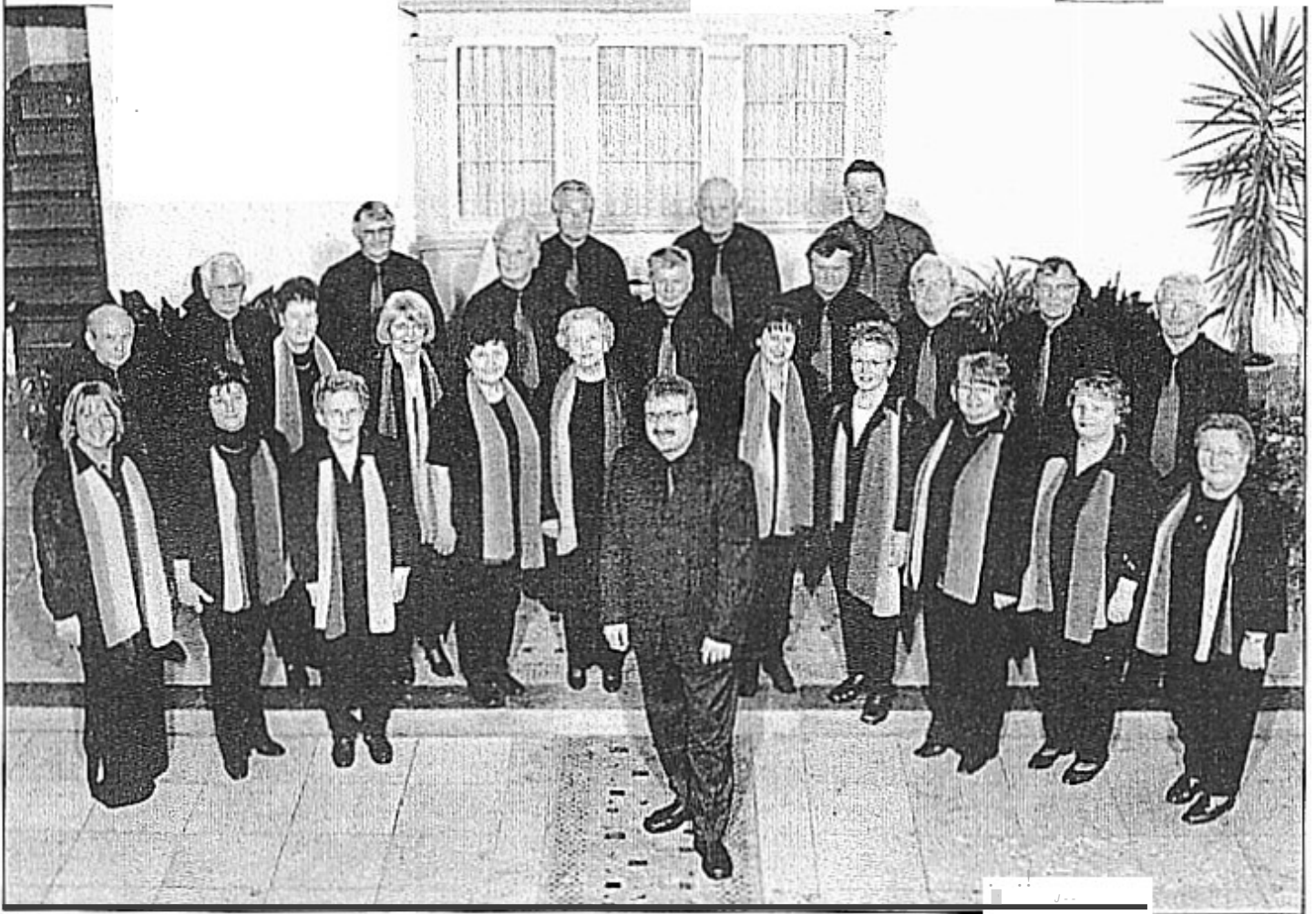
Unser Chor Im Jubiläumsjahr 2005