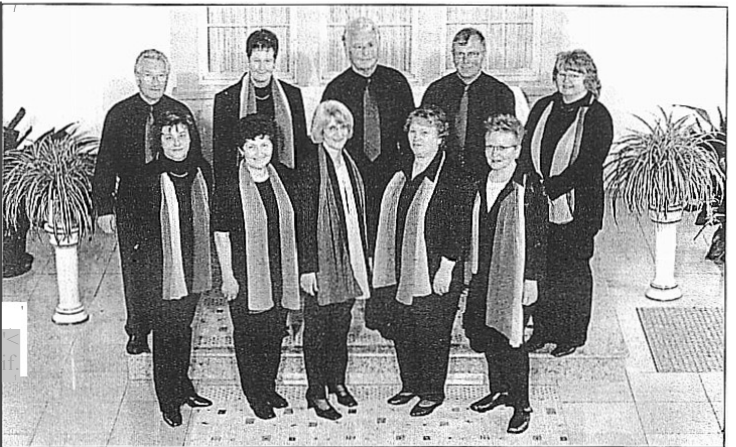
Gesamtvorstand im Jahr 2005