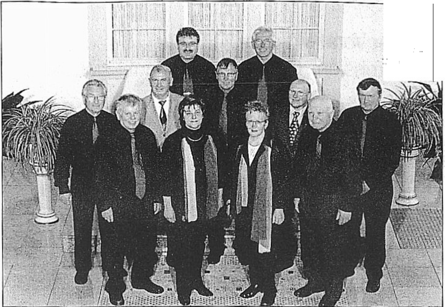
Bau- und Wirtschaftsausschuss Im Jahr 2005