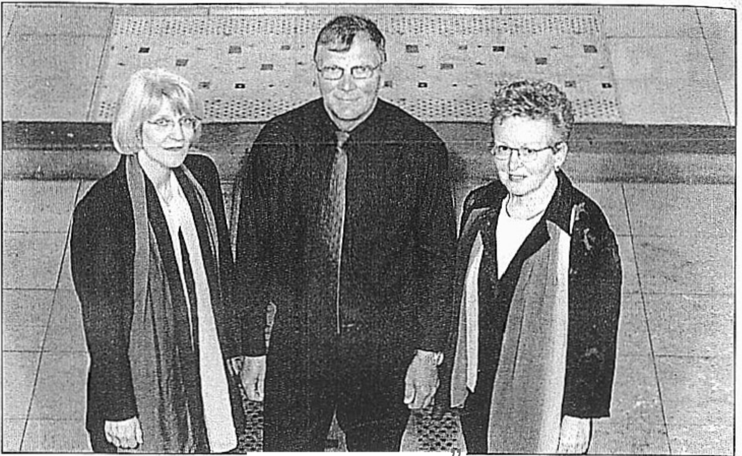
Geschäftsführender Vorstand im Jahr 2005 von links nach rechts